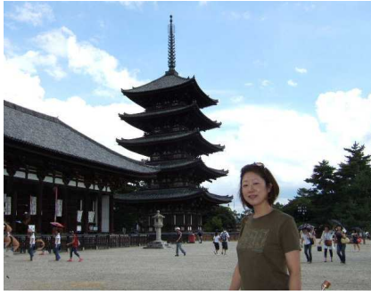
興福寺の五重の塔