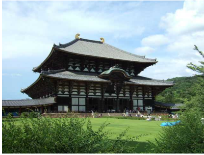
東大寺は屋根が修復されている